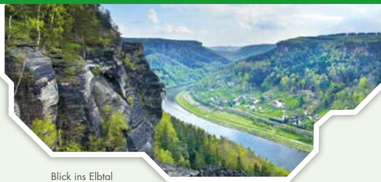
Blick ins Elbtal