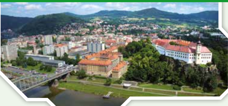
Blick auf Děčín