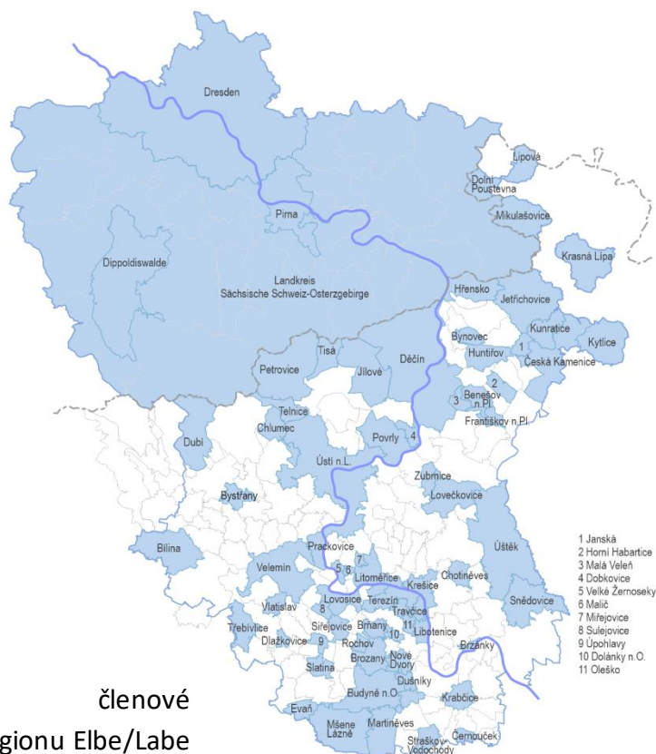
členové Euroregionu Elbe/Labe