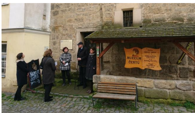
OPS kultura, cestovní ruch, dne 12.03.2020 v Ústěku

OPS kultura, cestovní ruch byla jediná skupina, které se podařilo uspořádat schůzi 12. března, tedy den před uzavřením hranic. To se odehrálo v Ústěku. Zajímavé je, že se zúčastnili pouze členové německé sekce. Mnozí čeští účastníci měli od svých institucí zakázáno setkávat se se zahraničními osobami. Obsahem jednání byla žádost o zápis Krušných hor na seznam světového dědictví UNSECO a turistické aktivity města Ústěk. Ty jsme také navštívili během prohlídky města s průvodcem.