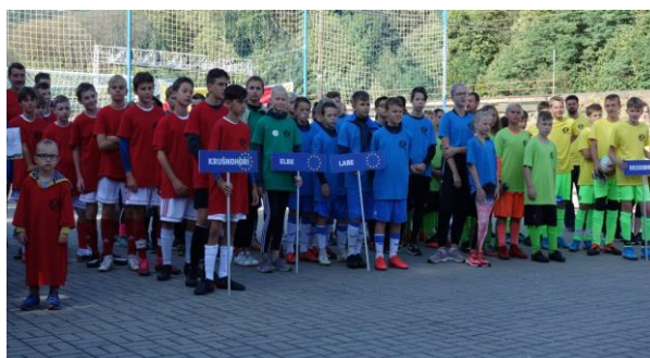
Zahájení sportovních her dvou Euroregionů 18.09.2021 v Bílině

Společné sportovní hry euroregionů Krušnohoří a ELbe/Labe, které se staly tradicí, se konaly navzdory pandemii, tentokrát 18. září v Bílině. Za ideálního počasí soutěžilo přibližně 150 dětí z České republiky a Saska ve volejbale, fotbale a atletice. Akce byla