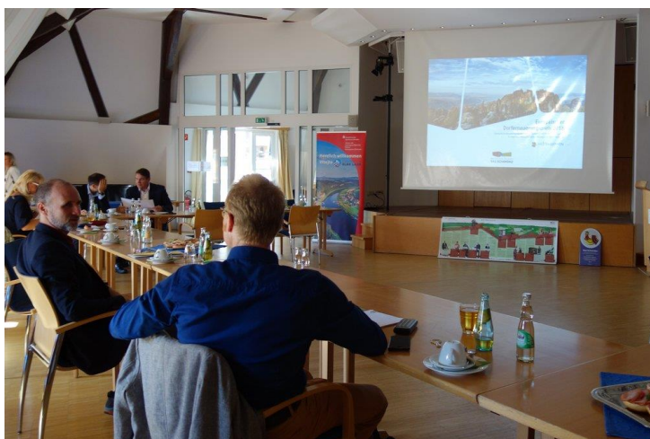
OPS pro územní rozvoj dne 00.09.2020 v Bad Schandau