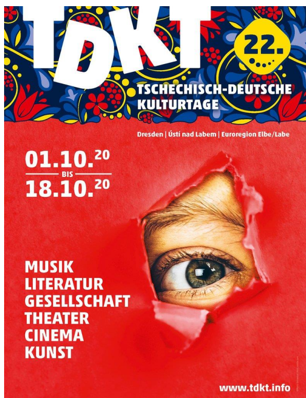
Plakát 22. česko-německých kulturních dnů