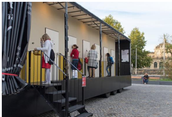
Výstava „Nejsme tu sami“ dne 02.10.2021 v Dresden

V rámci TDKT, ale jako samostatný projekt, byla ve spolupráci s českou organizací Paměť národa připravena výstava o národnostních menšinách v České republice, která byla vystavena v Drážďanech, Dippoldiswalde a Sebnitz a ve spolupráci s Collegiem Bohemicum v Ústí nad Labem a Litoměřicích. Tato výstava byla umístěna na přívěsu nákladního automobilu, který mohli návštěvníci obcházet a kukátkem sledovat rozhovory se zástupci různých menšin. Výstavu navštívilo odhadem 2 500 návštěvníků.