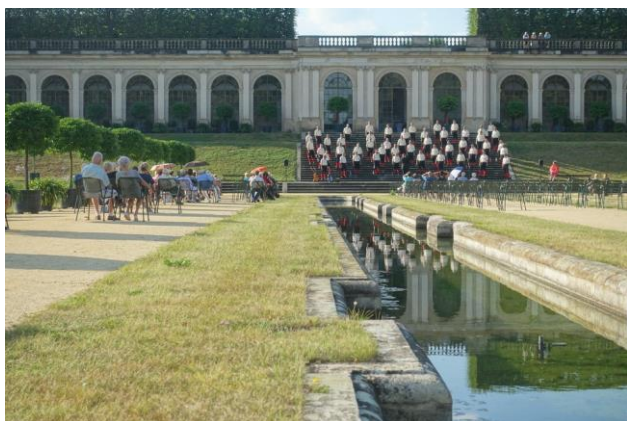
Koncert sboru Bergsteigerchor „Kurt Schlosser“, 19.08.2021 v barokní zahradě Großsedlitz

podpořena z Fondu malých projektů Euroregionu Elbe/Labe.