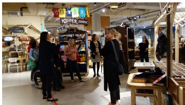
OPS kultura, cestovní ruch v Oskarshausenu dne 03.09.2020

Druhé zasedání odborné pracovní skupiny se konalo 3. září v zábavním parku dětský svět (Kindererlebniswelt Oskarshausen) ve Freitalu. Toto zařízení prezentovalo sebe a své aktivity s cílem přilákat také české návštěvníky a následně bylo zařazeno do kulturního pasu euroregionu.