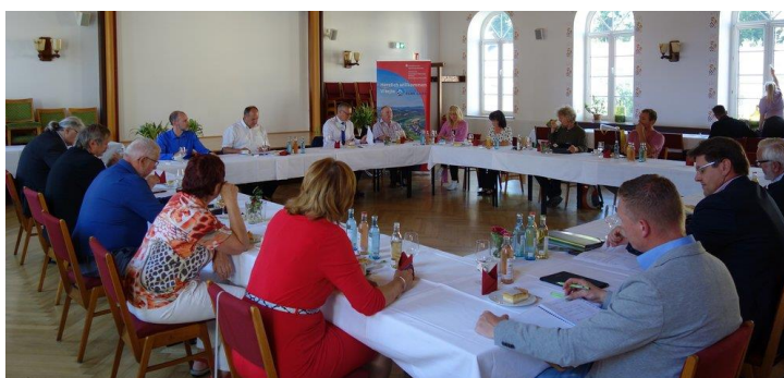
Zasedání Rady EEL dne 08.09.2020 v Bad Gottliebě

Rada Euroregionu Elbe/Labe se sešla na svém výročním zasedání dne 8. září 2020 v Bad Gottliebě v hostinci Gasthof Hillig. Toto poněkud neobvyklé místo konání bylo vybráno proto, aby byly zajištěny potřebné vzdálenosti mezi účastníky kvůli pandemii. Před zasedáním byla radním nabídnuta prohlídka sbírek historie medicíny v Bad Gottliebě.