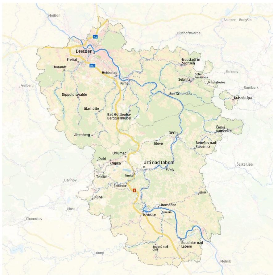
území Euroregionu Elbe/Labe