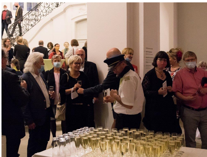
Eröffnung der 22. TDKT im Stadtmuseum Dresden

výměně zkušeností. Během festivalového období od 1. do 18. října muselo být zrušeno pouze šest z 54 akcí plánovaných německou stranou. Bohužel se nemohl uskutečnit žádný z koncertů, které německá strana v České republice plánovala. Některé akce – zejména čtení - byly zcela nebo částečně přesunuty do virtuálního prostoru, což se velmi osvědčilo. Celkem bylo navzdory přísným kapacitním omezením na festivalu přítomno přibližně 2100 návštěvníků.