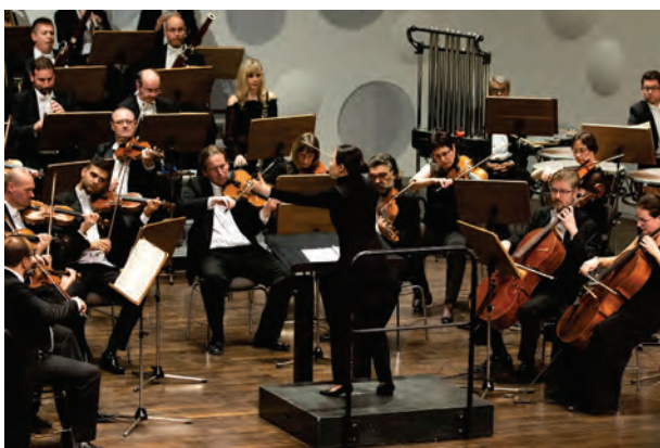
Koncert stipendistů dne 31.10.2018 na Drážďanské konzervatoři