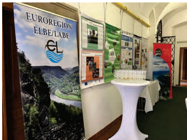
Stánek Euroregionu Elbe/Labe Letní slavnosti Kontaktní kanceláře v Praze dne 14.09.2018

Letní slavnost Kontaktní kanceláře Svobodného státu Sasko v Praze byla v roce 2018 organizována společně se Zemským okresem Saské Švýcarsko a Východní Krušnohoří. Prezentace ukázala českému publiku velkou rozmanitost. Také Euroregion Elbe/Labe byl 14. 9. přítomen na stánku slavnosti a prezentoval řadu plakátů a zároveň informoval o své práci, o řadě projektů a také o DČNK. Byla velká poptávka po informačních materiálech Euroregionu, které byly kompletně rozebrány.