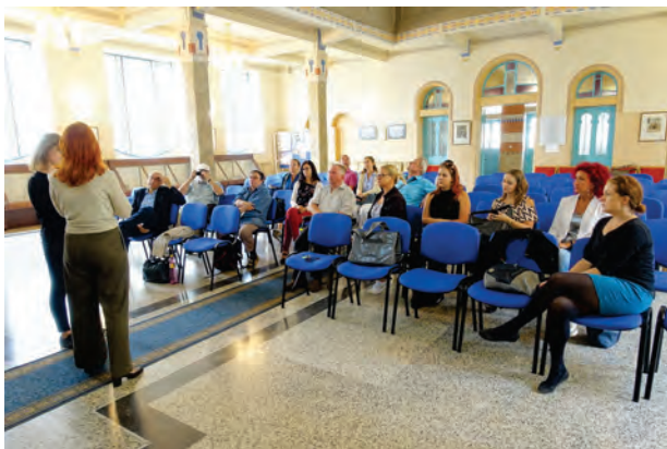
Prohlídka Synagogy v Děčíně dne 28.08.2018