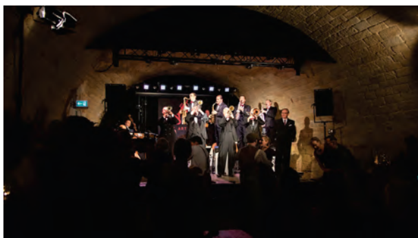
Melody Makers v Jazzclub Tonne dne 28.10.2018

Přesto, že festival vynechal prolog a epilog, tak s celkově 86 akcemi (61 na saské straně, 25 na české straně) dosáhl festival téměř stejný počet projektů jako v předchozích letech. S 5300 návštěvníky, bez přihlízejících při venkovních představeních, dosáhl festival téměř nejlepších výsledků z minulých ročníků. Přičemž různé žánry měly rozdílnou návštěvnost. Nejlépe se dařilo v oblasti klasické hudby, jazzu, zatímco představení z oblasti literatury a filmu na tom byly hůř. Velkým problémem se stal nízký stav vody v Labi, který neumožnil příplutí lodě Cargo Gallery tzn. plánovaná představení se musela přesunout do alternativních prostor, což ovlivnilo taky nízkou návštěvnost.