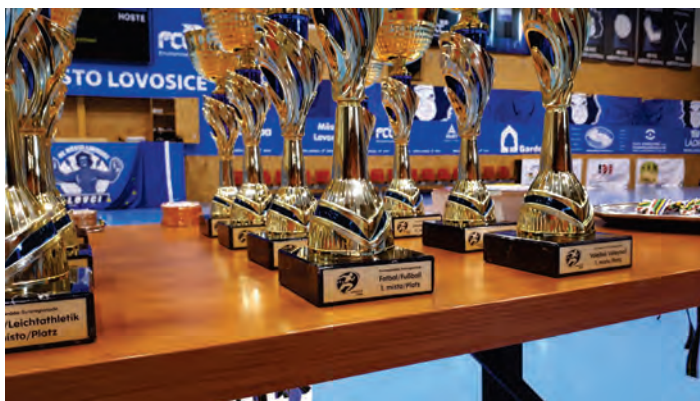
Ceny už čekají na své majitelé. Sportovní hry dvou Euroregionů dne 14.9.2018 v Lovosicích

Opět se setkalo a poměřilo cca 200 dětí v následujících sportech: atletika, volejbal, fotbal. Pro rok 2018 byl zvolen jako ukázkový sport házená, která má v Lovosicích velkou tradici. Sportovní hry proběhly velmi úspěšně, účastníkům ze strany dětí i trenérů se hry velmi líbily. Při větším rozsahu došlo i k drobným organizačním problémům, které jsme nakonec vyřešili ke spokojenosti všech.