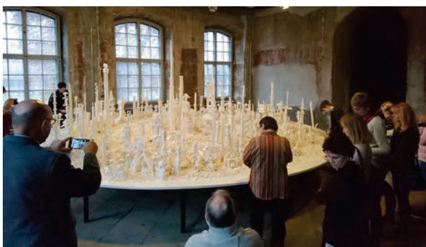
OPS na dětském bienále v Japonském paláci dne 27.11.2018

Ústí nad Labem a jde o rozšíření nabídky pro návštěvníky. Dále bylo informováno o stavu příprav DČNK.