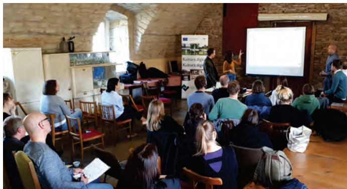
Workshop projektu kultura.digital v Řehlovicích dne 26.9.2018.

zájemce o současném umění v celém regionu. Zároveň aplikace nabídne informace o dopravě, konání výstav či jiných událostech z oblasti současného umění. K tématu obsahu stránek jsme uspořádali workshop v Kulturním centru Řehlovice dne 26. 9. 2018. Projekt bude ukončen v polovině roku 2019.