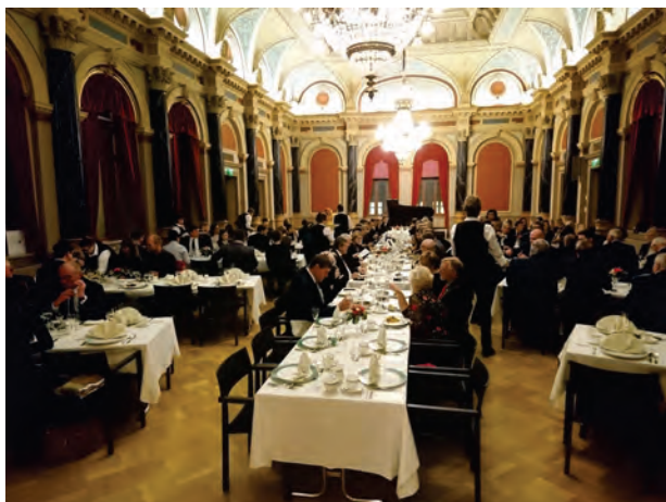
Recepce regionu a města Oulu na radnici

Výroční konference AGEG se konala v roce 2019 v Oulu v Severním Finsku ve finsko-švédském hraničním regionu Botnian Arc. Hlavním tématem konference byla digitalizace, protože v Oulu patří k inovativním a hospodářsky nejsilnějším městům Finska.