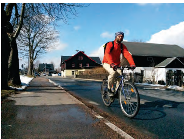
Ekologický příjezd na OPS pro hospodářství, vědu a vzdělávání dne 27.3.2018 v Schellerhau