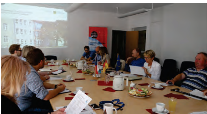
OPS pro územní rozvoj dne 11. 9. 2018 v Drážďanech