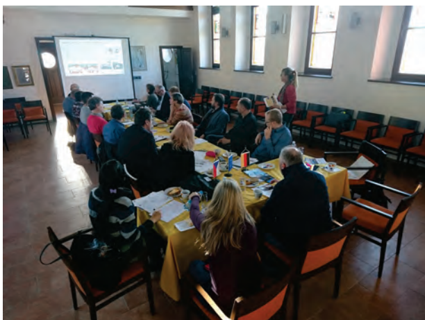
OPS pro územní rozvoj dne 5. 11. 2018 v Dolní Poustevně

Dne 5. 11. zasedala OPS v Dolní Poustevně. Hlavním bodem byla problematika Šluknovského výběžku. Starostové ze Sebnitz a Dolní Poustevny představili strategické rozvojové cíle svých měst. Rovněž MAS Sever a Landschaf(f)t Zukunft e.V. tematizovala aktivity souvisejícím s územním rozvojem.