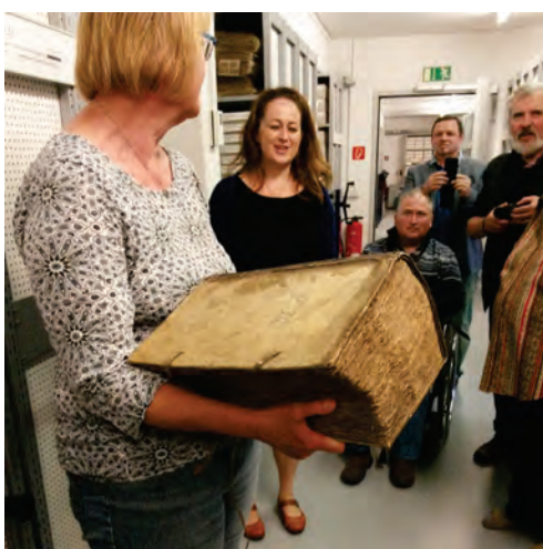
Prohlídka OPS Městského archivu Drážďany dne 14. 6. 2018