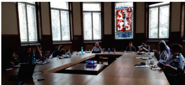
OPS pro územní rozvoj dne 13. 4. 2018 v Děčíně

První zasedání pracovní skupiny se konalo 13. dubna na Magistrátu města Děčín. Na jednání se představil Pozemkový úřad Ústeckého kraje, která je důležitou institucí pro celkový územní rozvoj. Tato instituce nemá na saské straně obdobný úřad. Dále se jednání účastnila MAS Sever, která představila