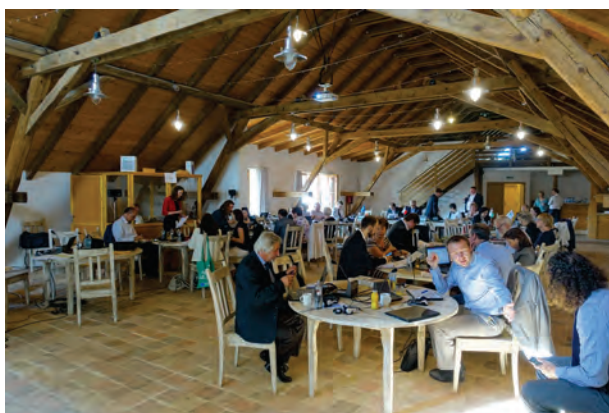
Zasedání MV v Dvoře Perlová voda (Budyně nad Ohří) dne 14. 5. 2018

Monitorovací výbor se v průběhu roku 2018 vedle rozhodování o jednotlivých projektech věnoval také otázkám uspořádání nového kooperačního programu v plánovacím období 2021+. V souvislosti s touto diskuzí se projevil velký rozdíl mezi saskou a českou delegací. Jako jasný příklad těchto diferencí se ukázal pohled na možnou změnu de-