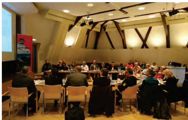
OPS ochrana před katastrofami dne 13. 11. 2018 v Bad Schandau

Po delší přestávce zasedala OPS ochrana před katastrofami dne 13. 11. 2018 v Bad Schandau. Zasedání se především věnovalo informacím o plánovaném velkém cvičení Schöna 2019 a také zapojení Euroregionu do rámcového programu tohoto cvičení. Zájem o zasedání byl tak velký, že se hosté téměř nevešli do zasedací místnosti. Bylo patrné, že spolupráci s českou stranou je třeba nadále posilovat. OPS rozhodla o organizační a finanční podpoře konference k otázce medicíny katastrof, která se bude konat den před samotným cvičením.