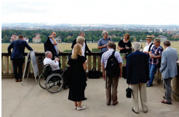
Malá prohlídka vinic před zahájením zasedání Rady EEL dne 19.06.2018

Stěžejními body zasedání Rady EEL byly Zpráva o činnosti EEL za období posledních 12 měsíců, stav přeshraničního dotačního programu a spolupráce včetně výhledu na následující rok.