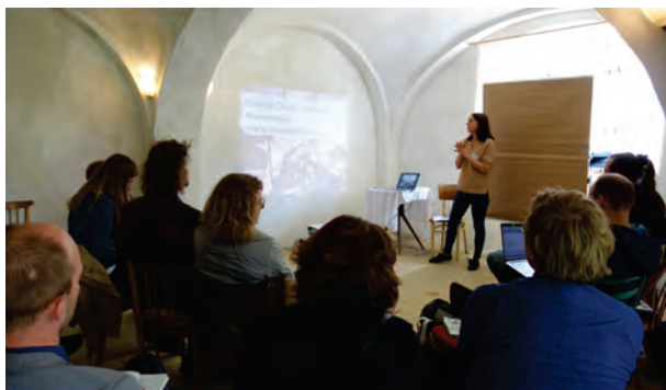
Workshop v rámci konference CBCC v Řehlovicích

Následující den proběhlo jednání na české straně v Kulturním centru v Řehlovicích. Účastníky zde přivítal prezident Výboru regionu a bývalý prezident AGEG Karl-Heinz Lambertz. Poté účastníci pokračovali rozdělení do osmi workshopů s různými tématy (možnosti kultury ve venkovském prostoru, praktické problémy s financováním a byrokracií, různé umělecké projekty na vodě a v krajině). Ukončení dne proběhlo na lodi Cargo Gallery v Děčíně.